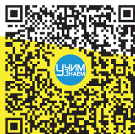
Методические рекомендации 2023 г.